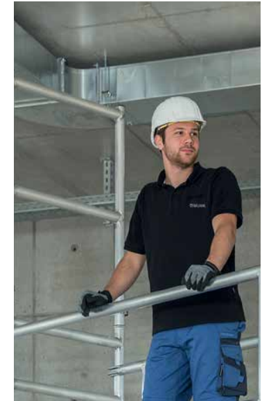
Abb. Bestell-Nr. 27991

Hinweis: Nach DIN EN 1004 werden zum sicheren Auf- und Abbau von Gerüsten zwei Montagesicherungsgeländer benötigt.